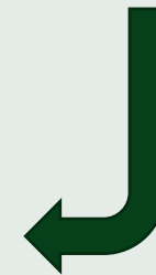
AVL eller Dansk Affaldsminimering, Randers

Plasten vaskes og oparbejdes til granulat