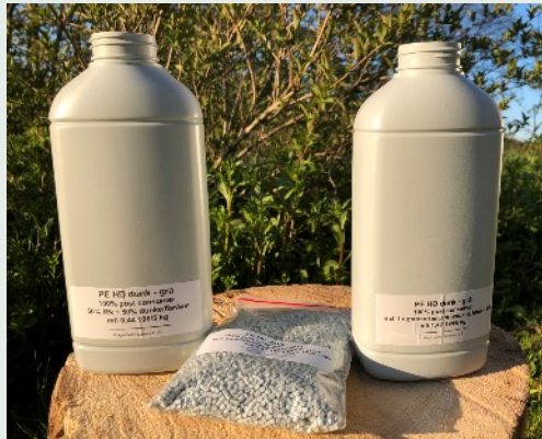
Nordjysk producent af sæbe- og rengøringsmidler