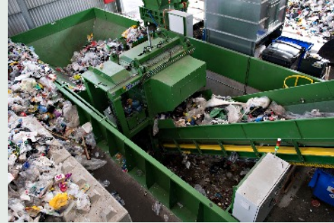
I/S Reno-Nord, Aalborg