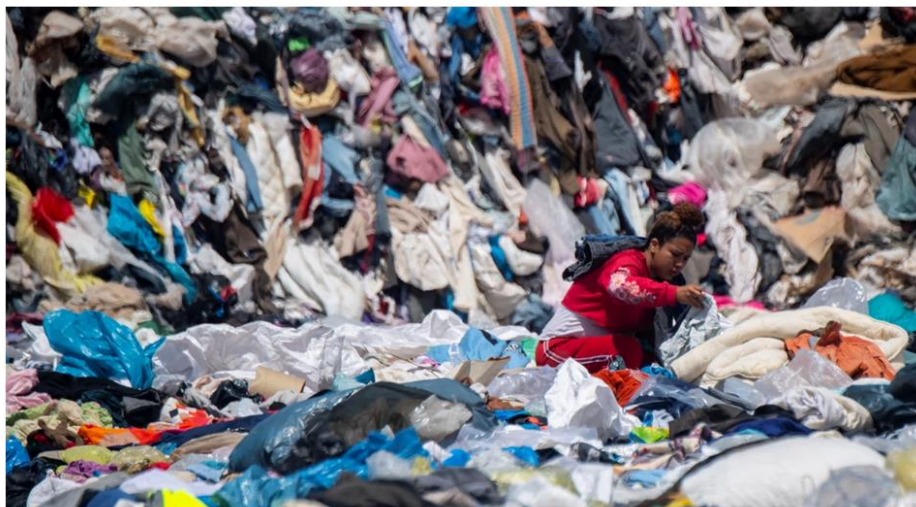
Tekstiler er vores nye 'plastikproblem'.... Foto fra Tanja Gotthardsens foredrag: Fra Trastalk til tøj-glæde.